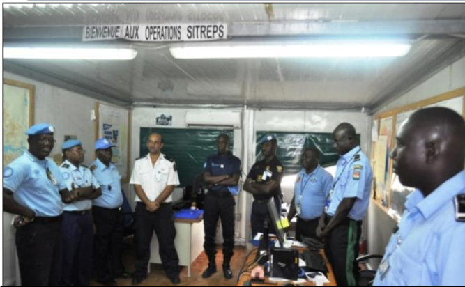
Le Chef de la composante Police à la cellule SITREPS