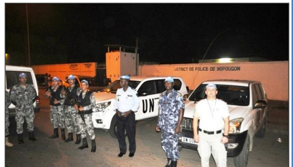
Patrouille mixte « UNPOL-FPU-POLICE du District de YOPOUGON »

En effet, afin d'aider les usagers de la route à moins subir les entraves au trafic, les forces de sécurité devront mettre en pratique de façon efficiente, les grands principes directeurs de leurs actions dans ce sens.