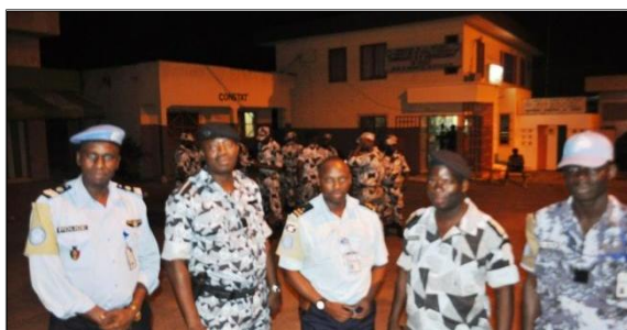
Patrouille mixte « UNPOL-FPU-Police du District de COCODY »

C'est justement à cela que veulent continuer à les assister les UNPOLs. S'y ajoutent que, grâce aux mérites du mentoring, qui consiste à travailler en synergie sur le terrain avec nos partenaires locaux, les UNPOLs se sont toujours montrés assez engagés.