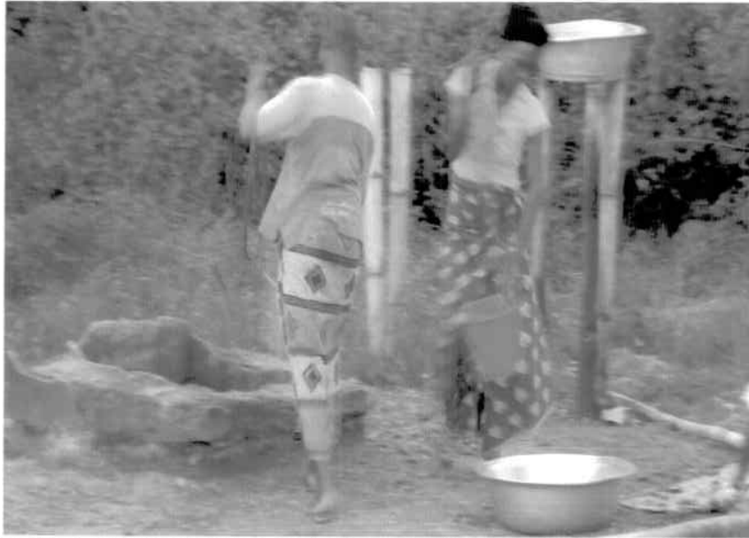
DEPUIS LA PANNE DE LA POMPE MNI LES FEMMES DU QUARTIER BAS DE MOPE S'APPROVISIONNENT EN EAU DANS CE PUIT QUI EN SAISON SECHE EST ARIDE