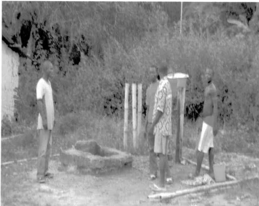
SOURCE D'APPROVISIONNEMENT EN EAU DE PUIT A MOPE