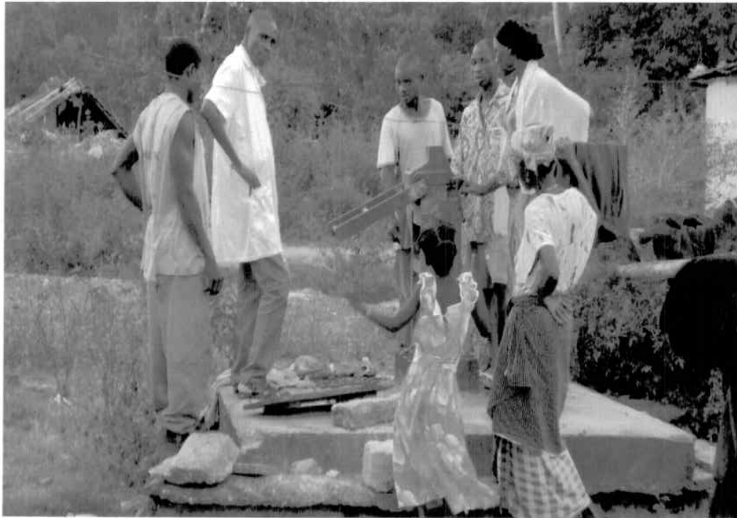
LA POMPE MN1 DU VILLAGE DE MOPE QUARTIER BAS ABANDONNEE PAR MANQUE DE PIECES DE RECHANGES DEPUIS 10 ANS UNE REGENERATION DE CE FORAGE EST NECESSAIRE POUR LA QUALITE DE L'EAU