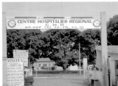
Façade Principale du CHR