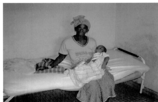
Malade installée sur un des matelas défectueux