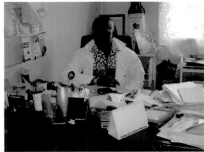
Bureau du Chef du Service de Pédiatrie