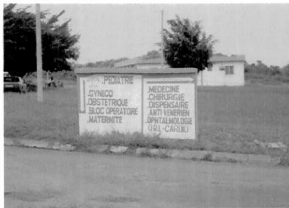
Panneau indicatif du Service de Pédiatrie