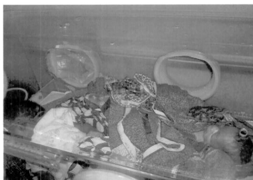
Couveuse fonctionnelle en surcharge (contenant 2 nouveaux nés dont un est prématuré)