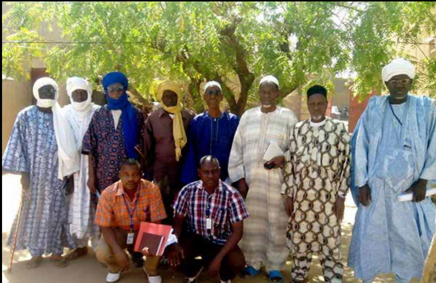
Sensibilisation auprès des chefs de quartiers de Gao, avril 2014