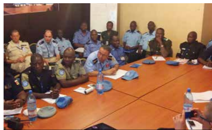
Formation des officiers UNPOL à Bamako, mars 2014